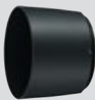
Gegenlichtblende HB-71 (im Lieferumfang)